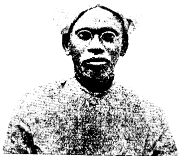
C. Sundara Sastrigal The Poet